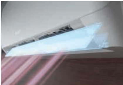
Çift kanallı hava çıkışı